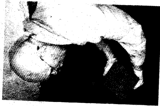
K NEJČASTĚJŠÍM nálezům patří středověké kachle ze závěru 15. století s motivem sv. Jiří, který zabíjí draka.

Pozn.: Autor je archeolog Muzea Jindřichohradecka