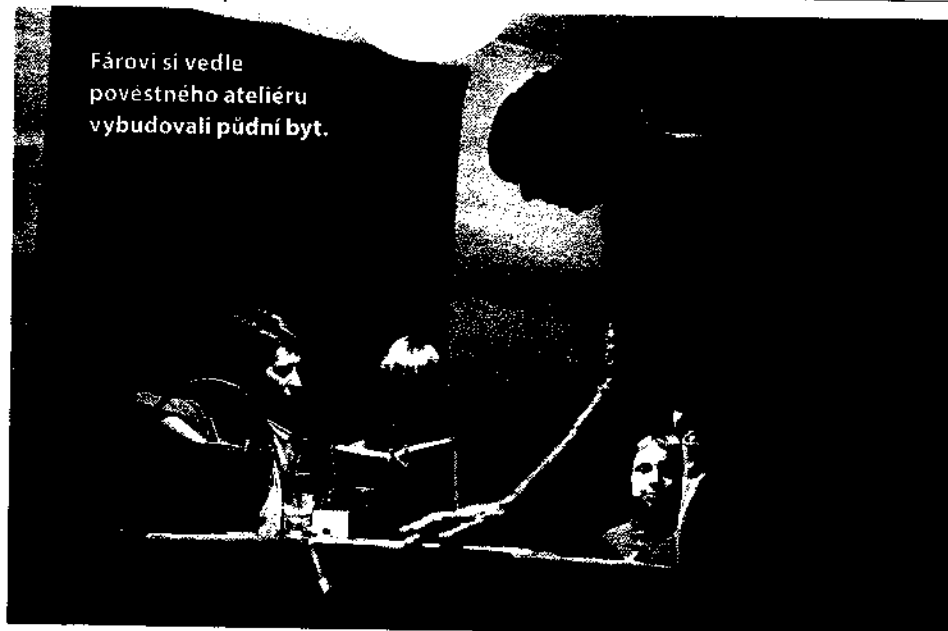
Fárovi si vedle pověstného ateliéru vybudovali půdní byt.