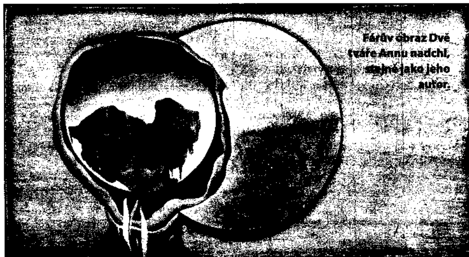
Fotív obraz Dvě tváře Annu nadchl, stále jako jeho autor.

Fotím. Většinou jsou to ženy, které chtějí dárek pro manžela. Pro ženu je důležité zaznamenat tu chvíli, kdy je krásná. Myslím, že to je nádherné a vždycky se to dělalo,